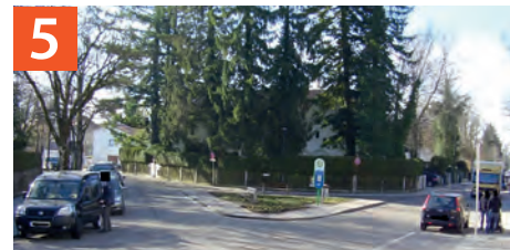
Aufgrund der insgesamt großen Verkehrsfläche muss mit besonderer Vorsicht die Straße überquert werden.