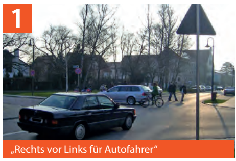
„Rechts vor Links für Autofahrer“ Kreuzungsbereich Jaiser- / Garten- bzw. Kagerbauerstraße

Bitte melden Sie sich bei der Schule, dem Elternbeirat oder bei der Polizei.