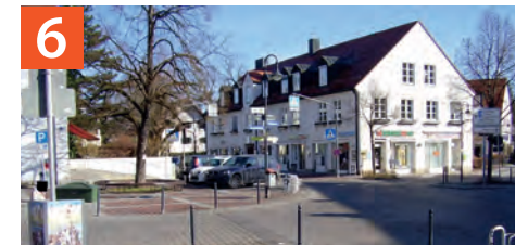
Auch hier gilt „Rechts-vor-Links“ für Autofahrer, diese richten daher ihre Aufmerksamkeit meist auf den Gegenverkehr und nicht auf Schulkinder.