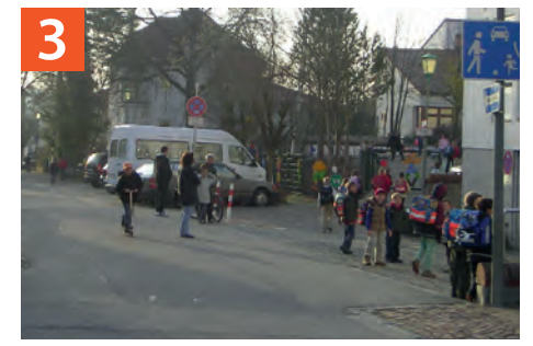
Verkehrsberuhigter Bereich Schulstraße