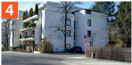
Aufgrund der leichten Biegung am Anfang der Bahnhofstraße ist der hier kommende Verkehr für Schulkinder schlecht erkennbar.