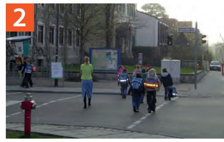
Ampeanlage Jaiserstraße / Johann-Bader-Straße